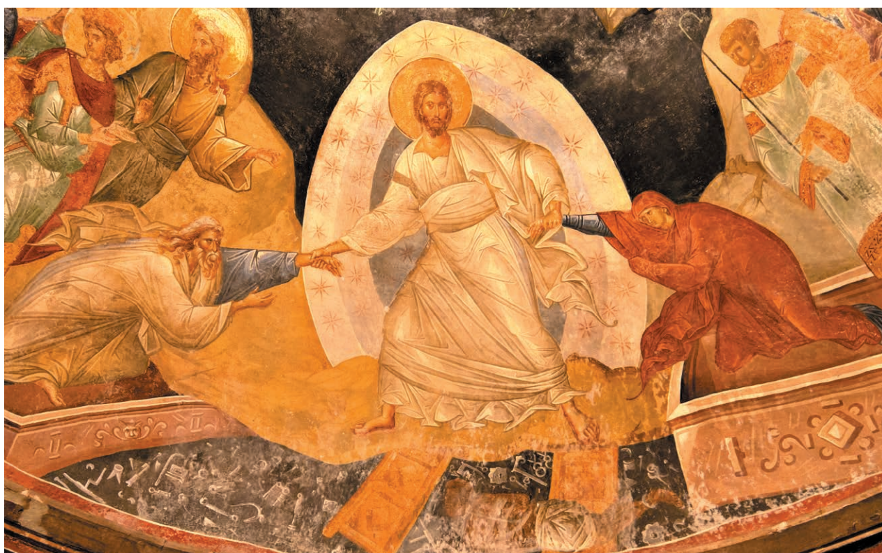
Fresque de la Descente aux enfers, église de Saint-Chora à Istanbul

Tropeaire du Grand Samedi, liturgie du Samedi matin